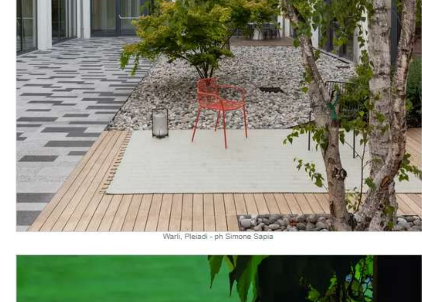
Warli, Pleiadi