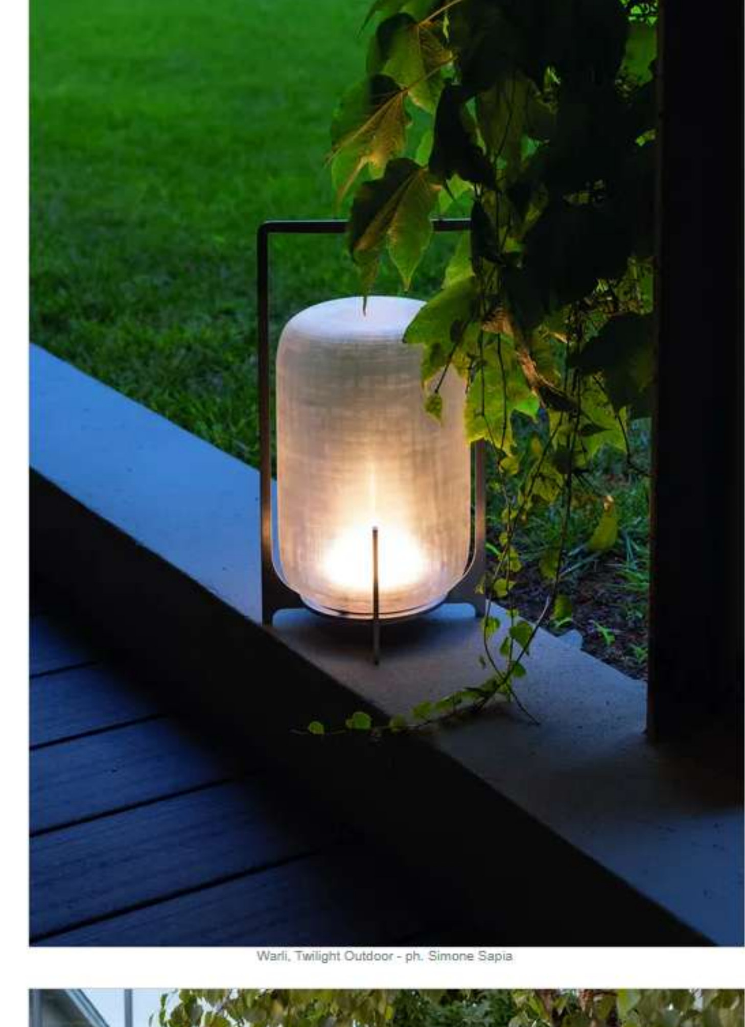
Warli, Twilight Outdoor