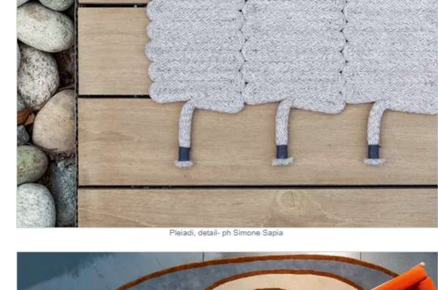
Pleiadi, detail